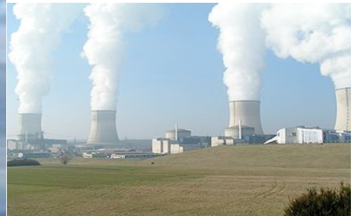
☀ Offshore und/oder Kernkraft ?

Nehmen wir an, dass der Seewind doppelt so lange bläst, wie derjenige auf dem Festland, dann kann man mit jährlich rund 3.000 Vollaststunden rechnen. Erzeugt werden 180 Millionen kWh. Der deutsche Gesetzgeber garantiert den Offshore-Verstromern eine Einspeisevergütung von 15 cents/kWh, während der Strom aus konventionellen Kraftwerken im Mix mit 5 cents/kWh ins öffentliche Netz eingespeist wird. Die Differenz von 10 cents/kWh bedeutet, dass der deutsche Stromverbraucher 18 Millionen € für den gesetzlich überteuerten Offshore-Strom zahlen muss, in 20 Jahren werden es 360 Millionen € sein.