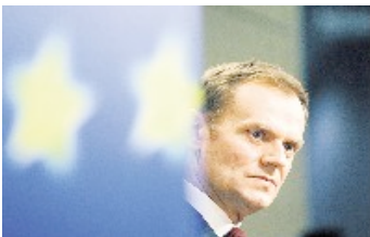
Sorge um Polen: Karlspreis-Tusk

Die Trauer über die Toten von Smolensk bleibt, spekuliert wird dennoch viel