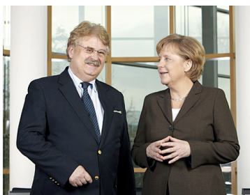
Angela Merkel + Elmar Brok

auf die asche gepfeifen + merkel im medien-hagel + problem mit biokraftstoff + hilft kirche kaczyński-bruder? + gigantische windkraftkosten + online-wahlkampf überschätzt + stefan aust verstolpert + naumanns kronprinz ++ 'talk im turm' revitalisiert + kodex vom neuen dpa - chefredakteur