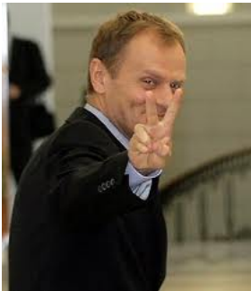
. Wahlsieger Donald Tusk

✘ This e-mail is being sent as a memorial chain, in memory of the 6 million Jews, 20 million Russians, 10 million Christians, and also 1,900 Catholic priests who were murdered, raped, burned, starved, beaten and humiliated.“